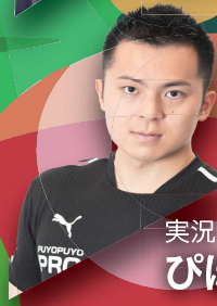
実況 ぴぽにあプロ